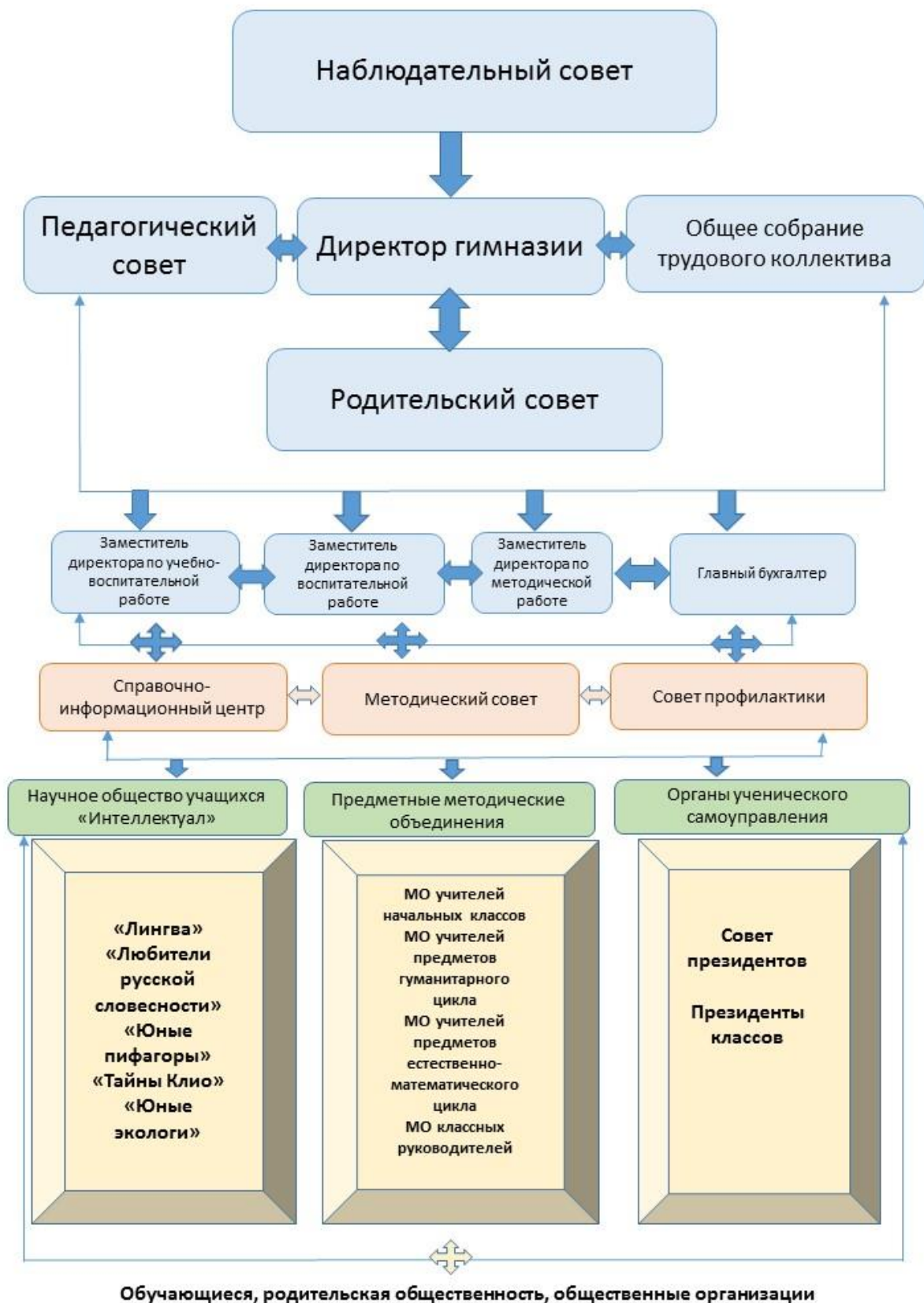
Рис.1 Система управления Гимназии